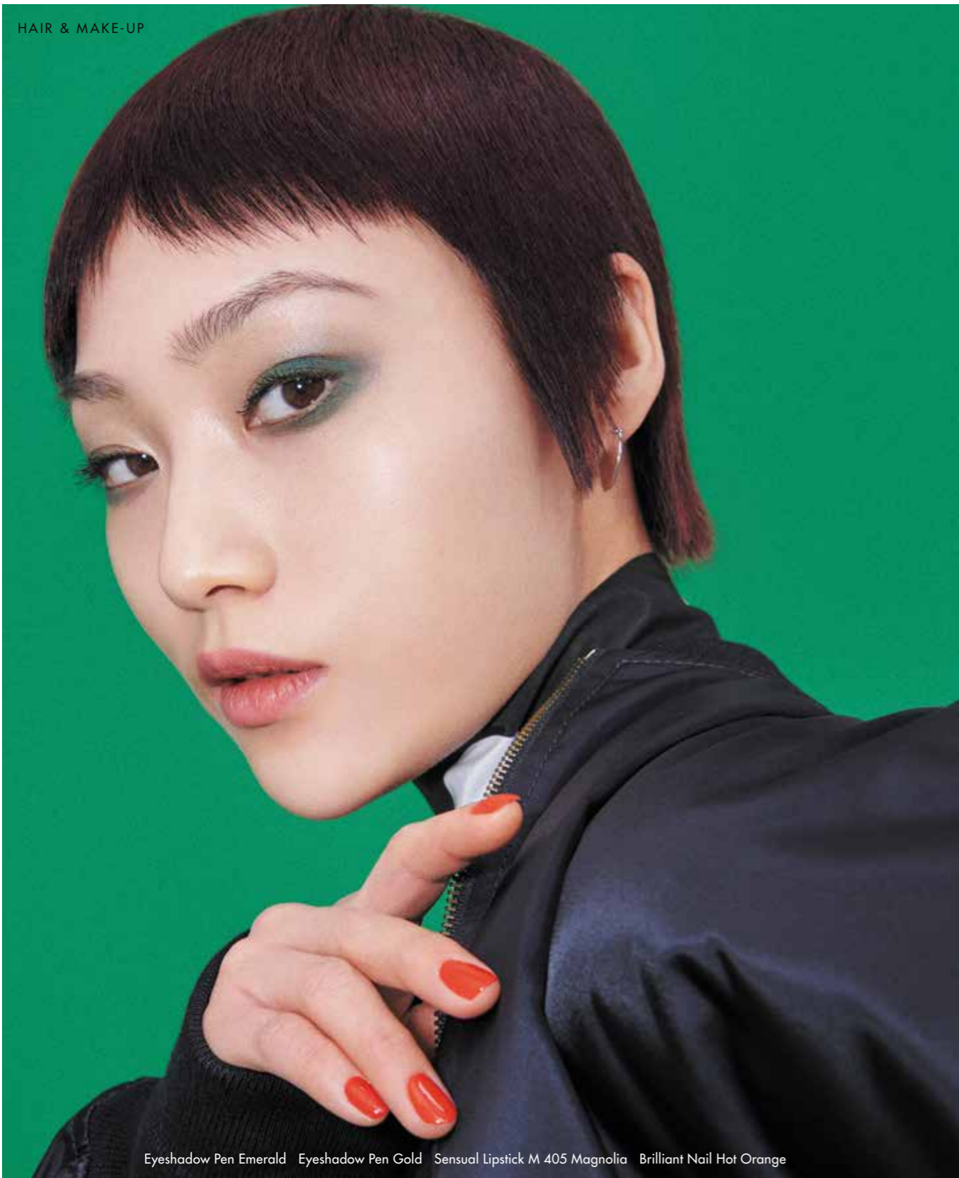
Eyeshadow Pen Emerald Eyeshadow Pen Gold Sensual Lipstick M 405 Magnolia Brilliant Nail Hot Orange