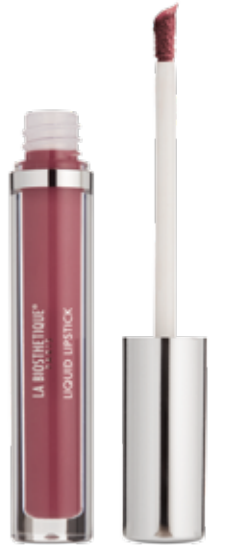
Liquid Lipstick Frosted Berry