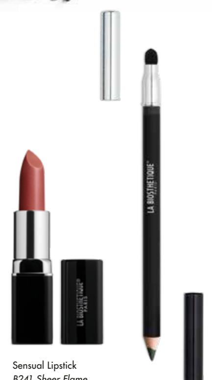
Sensual Lipstick B241 Sheer Flame