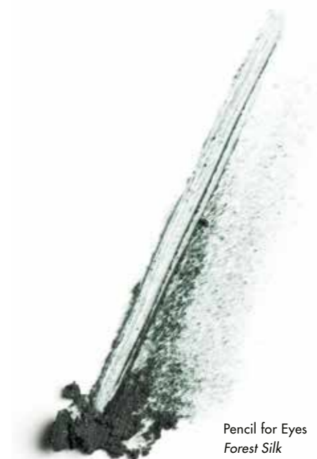
Pencil for Eyes Forest Silk