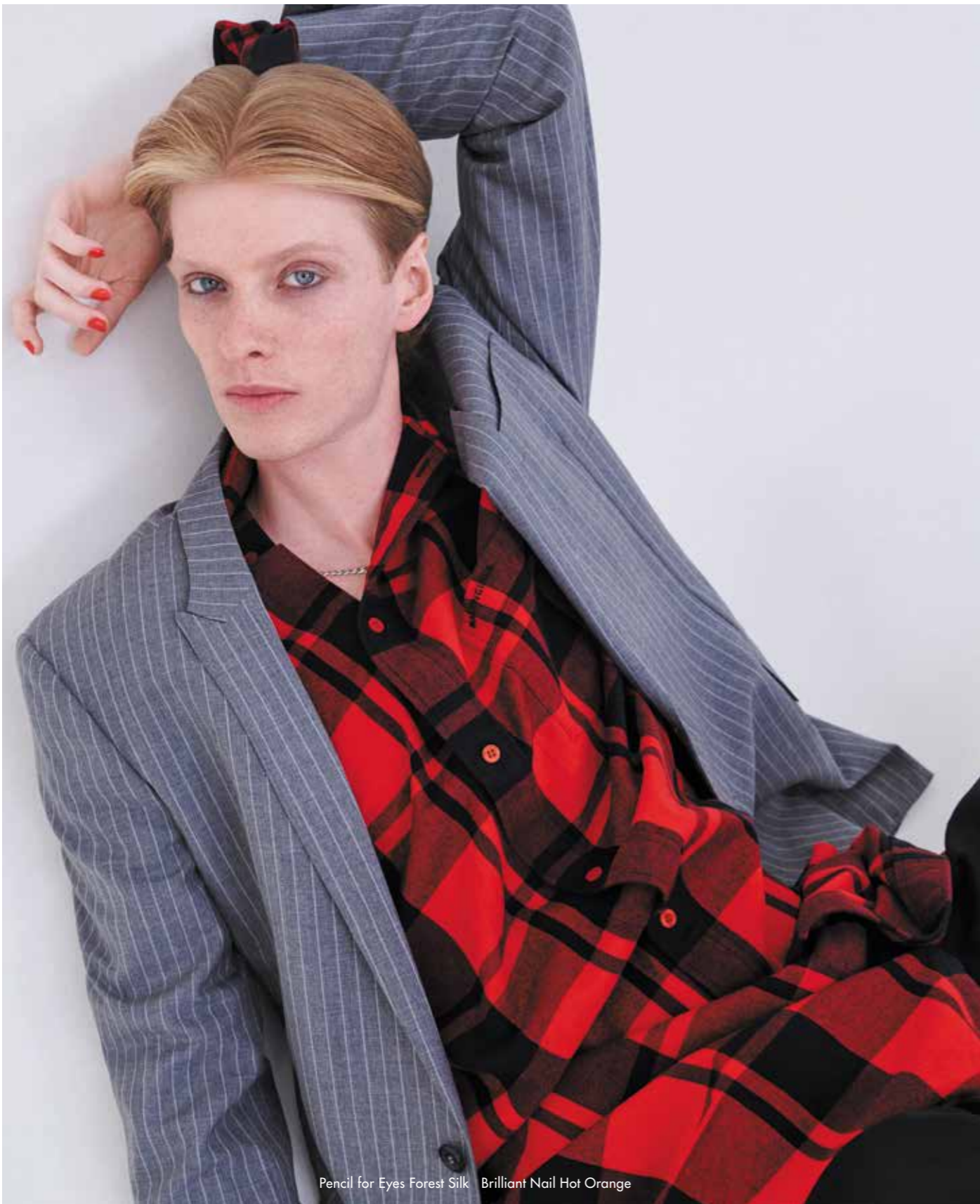
Pencil for Eyes Forest Silk Brilliant Nail Hot Orange